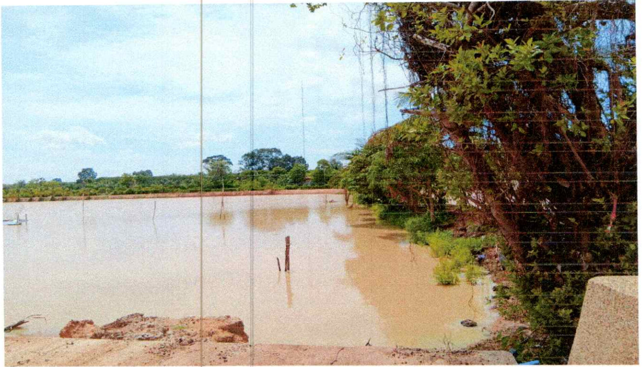
ภาพประกอบ แหล่งเก็บน้ำ หนองผือ อบต.กระเจาย